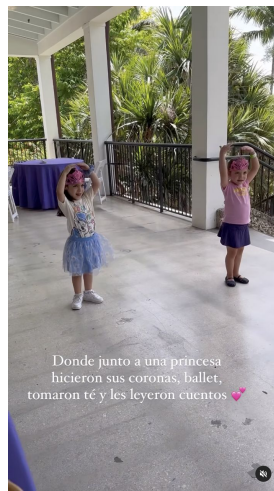
Donde junto a una princesa hicieron sus coronas, bailar, tomaron té y les leyeron cuentos 🍷