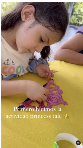
Primero hicimos la actividad princess tale 🍷