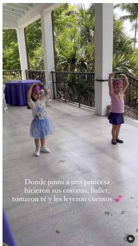
Donde junto a una princesa hicieron sus coronas, ballet, tomaron té y les leyeron cuentos 🍷

maestefaniou @maestefaniou Beachorimes, Tia Tia · Do It Better maestefaniou @maestefaniou Día de naturaleza, princesas y dragones 🐉 Así de completa fue nuestra experiencia en @fairchildgarden que tiene su exhibición de dragones hasta el 4 de Septiembre! Entrada al parque para adultos $24,95 niños entre 6-17años $11,95 menos de 5 GRATIS Princesa Tale entradas niños 2-11años $24,95 y mayores $15,95 Tienen todos los dragones, áreas como rainy forest donde adentrarte y conectar con la naturaleza, carritos para movilizarte, personal haciendo juegos para niños y un área de mariposas 🦋 hermosas! Así como también un comedor con aire acondicionado donde refrescarte! Debo admitir que aunque hace calor por tener tantos árboles siempre tendrás sombra 🌿 ¿Cuántame haz ido? Fue nuestra primera vez y sin duda volveremos 💖 #faichild #momblogger #familyblogger #miamiwithkids #whattodoinmiami #dragons enriqueus70 Se ve q la pasaran súper 🍀🍀🍀 Liked by sincerelymnu and 169 others