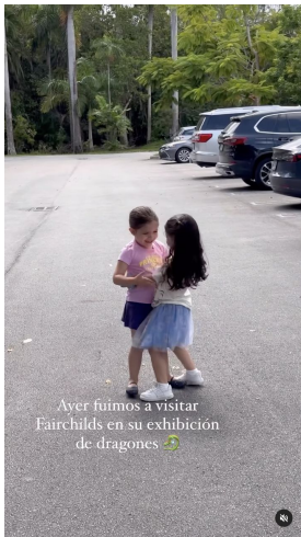
Ayer fuimos a visitar Fairchild's en su exhibición de dragones 🐉