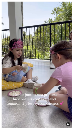
Donde junto a una princesa hicieron sus coronas, ballet, tomaron té y les leyeron cuentos 🍷

maestefaniou @maestefaniou Beachorimes, Tia Tia · Do It Better maestefaniou @maestefaniou Día de naturaleza, princesas y dragones 🐉 Así de completa fue nuestra experiencia en @fairchildgarden que tiene su exhibición de dragones hasta el 4 de Septiembre! Entrada al parque para adultos $24,95 niños entre 6-17años $11,95 menos de 5 GRATIS Princesa Tale entradas niños 2-11años $24,95 y mayores $15,95 Tienen todos los dragones, áreas como rainy forest donde adentrarte y conectar con la naturaleza, carritos para movilizarte, personal haciendo juegos para niños y un área de mariposas 🦋 hermosas! Así como también un comedor con aire acondicionado donde refrescarte! Debo admitir que aunque hace calor por tener tantos árboles siempre tendrás sombra 🌿 ¿Cuántame haz ido? Fue nuestra primera vez y sin duda volveremos 💖 #faichild #momblogger #familyblogger #miamiwithkids #whattodoinmiami #dragons enriqueus70 Se ve q la pasaran súper 🍀🍀🍀 Liked by sincerelymnu and 169 others