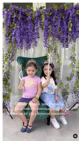
Donde junto a una princesa hicieron sus coronas, ballet, tomaron té y les leyeron cuentos 🍷

maestefaniou @maestefaniou Beachorimes, Tia Tia · Do It Better maestefaniou @maestefaniou Día de naturaleza, princesas y dragones 🐉 Así de completa fue nuestra experiencia en @fairchildgarden que tiene su exhibición de dragones hasta el 4 de Septiembre! Entrada al parque para adultos $24,95 niños entre 6-17años $11,95 menos de 5 GRATIS Princesa Tale entradas niños 2-11años $24,95 y mayores $15,95 Tienen todos los dragones, áreas como rainy forest donde adentrarte y conectar con la naturaleza, carritos para movilizarte, personal haciendo juegos para niños y un área de mariposas 🦋 hermosas! Así como también un comedor con aire acondicionado donde refrescarte! Debo admitir que aunque hace calor por tener tantos árboles siempre tendrás sombra 🌿 ¿Cuántame haz ido? Fue nuestra primera vez y sin duda volveremos 💖 #faichild #momblogger #familyblogger #miamiwithkids #whattodoinmiami #dragons enriqueus70 Se ve q la pasaran súper 🍀🍀🍀 Liked by sincerelymnu and 169 others