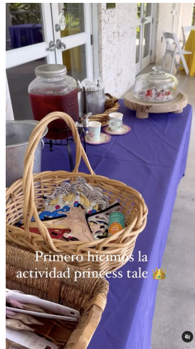
Primero hicimos la actividad princess tale 🍷