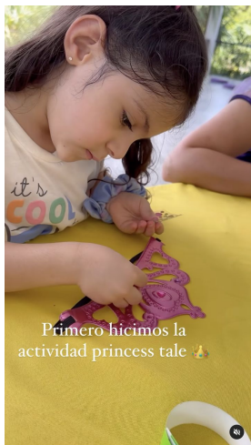
Primero hicimos la actividad princess tale 🐉

maestefaniou @maestefaniou Beachorimes, Tia Tia · Do It Better maestefaniou @maestefaniou Día de naturaleza, princesas y dragones 🐉 Así de completa fue nuestra experiencia en @fairchildgarden que tiene su exhibición de dragones hasta el 4 de Septiembre! Entrada al parque para adultos $24,95 niños entre 6-17años $11,95 menos de 5 GRATIS Princesa Tale entradas niños 2-11años $24,95 y mayores $15,95 Tienen todos los dragones, áreas como rainy forest donde adentrarte y conectar con la naturaleza, carritos para movilizarte, personal haciendo juegos para niños y un área de mariposas 🦋 hermosas! Así como también un comedor con aire acondicionado donde refrescarte! Debo admitir que aunque hace calor por tener tantos árboles siempre tendrás sombra 🌿 ¿Cuántame haz ido? Fue nuestra primera vez y sin duda volveremos 💖 #faichild #momblogger #familyblogger #miamiwithkids #whattodoinmiami #dragons enriqueus70 Se ve q la pasaran súper 🍀🍀🍀 Liked by sincerelymnu and 169 others