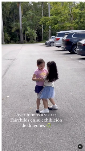
Ayer fuimos a visitar Fairchild's en su exhibición de dragones 🐉

maestefaniou @maestefaniou Beachorimes, Tia Tia · Do It Better maestefaniou @maestefaniou Día de naturaleza, princesas y dragones 🐉 Así de completa fue nuestra experiencia en @fairchildgarden que tiene su exhibición de dragones hasta el 4 de Septiembre! Entrada al parque para adultos $24,95 niños entre 6-17años $11,95 menos de 5 GRATIS Princesa Tale entradas niños 2-11años $24,95 y mayores $15,95 Tienen todos los dragones, áreas como rainy forest donde adentrarte y conectar con la naturaleza, carritos para movilizarte, personal haciendo juegos para niños y un área de mariposas 🦋 hermosas! Así como también un comedor con aire acondicionado donde refrescarte! Debo admitir que aunque hace calor por tener tantos árboles siempre tendrás sombra 🌿 ¿Cuántame haz ido? Fue nuestra primera vez y sin duda volveremos 💖 #faichild #momblogger #familyblogger #miamiwithkids #whattodoinmiami #dragons enriqueus70 Se ve q la pasaran súper 🍀🍀🍀 Liked by sincerelymnu and 169 others