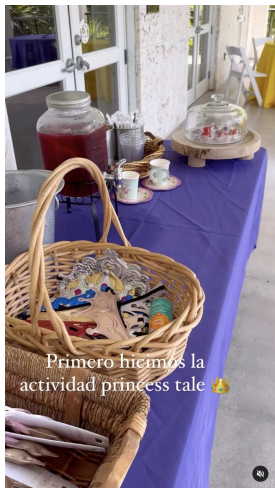
Primero hicimos la actividad princess tale 🐉

maestefaniou @maestefaniou Beachorimes, Tia Tia · Do It Better maestefaniou @maestefaniou Día de naturaleza, princesas y dragones 🐉 Así de completa fue nuestra experiencia en @fairchildgarden que tiene su exhibición de dragones hasta el 4 de Septiembre! Entrada al parque para adultos $24,95 niños entre 6-17años $11,95 menos de 5 GRATIS Princesa Tale entradas niños 2-11años $24,95 y mayores $15,95 Tienen todos los dragones, áreas como rainy forest donde adentrarte y conectar con la naturaleza, carritos para movilizarte, personal haciendo juegos para niños y un área de mariposas 🦋 hermosas! Así como también un comedor con aire acondicionado donde refrescarte! Debo admitir que aunque hace calor por tener tantos árboles siempre tendrás sombra 🌿 ¿Cuántame haz ido? Fue nuestra primera vez y sin duda volveremos 💖 #faichild #momblogger #familyblogger #miamiwithkids #whattodoinmiami #dragons enriqueus70 Se ve q la pasaran súper 🍀🍀🍀 Liked by sincerelymnu and 169 others